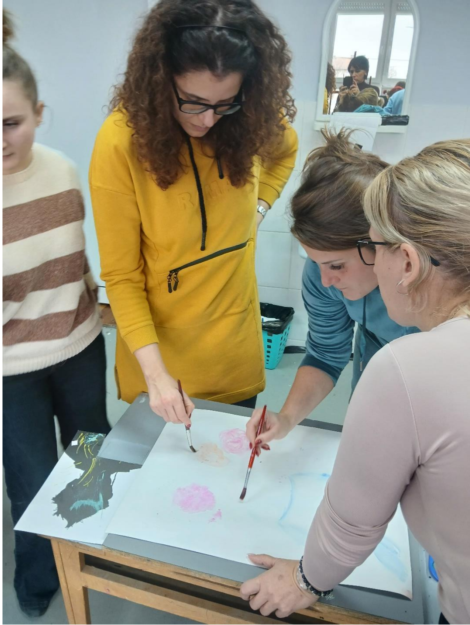
Proces – stojeći