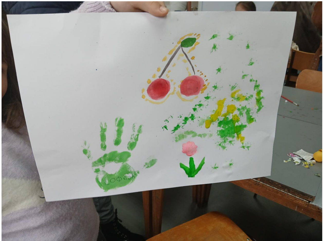
Deca i akvarel