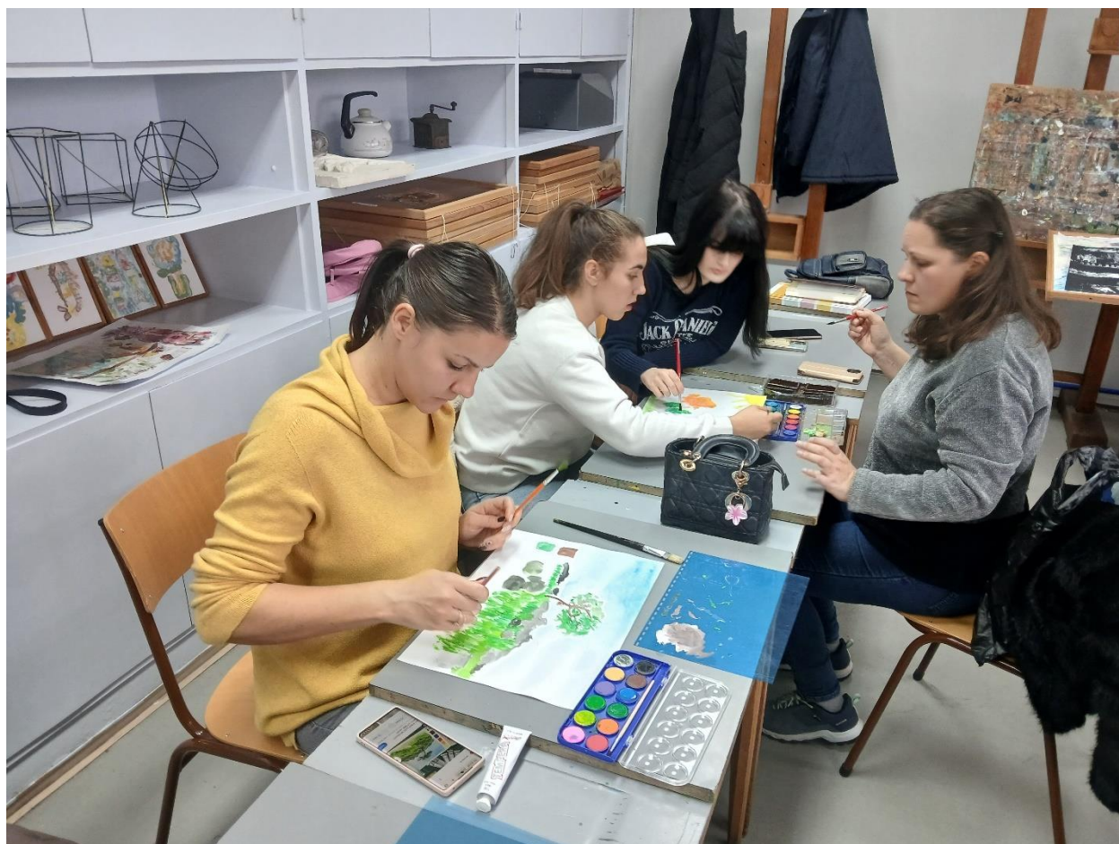
Proces – sedeći