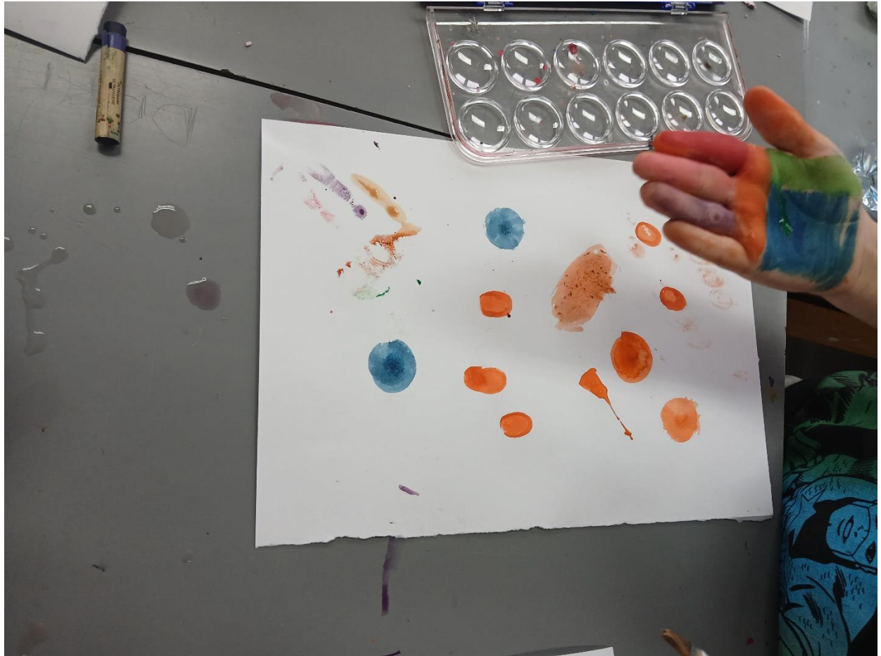
Likovna igra – akvarelom