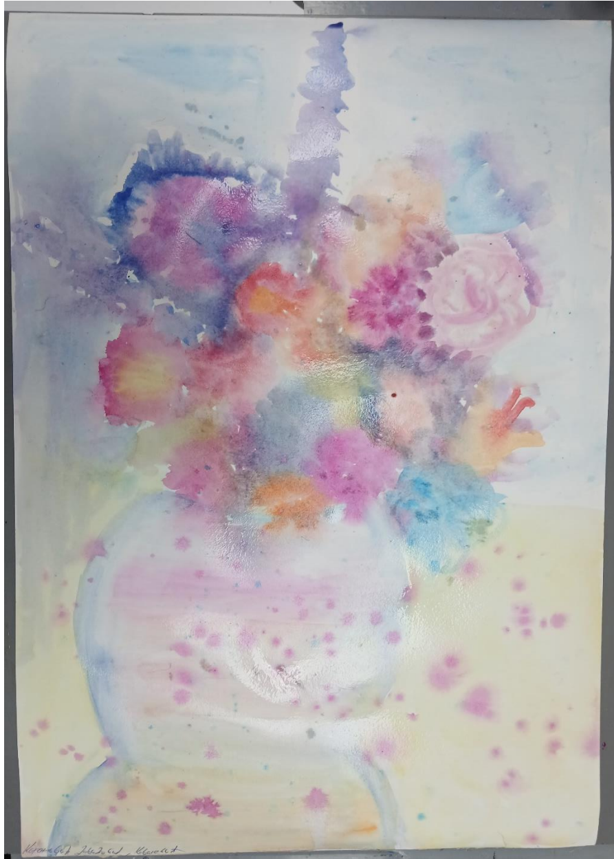
Cveće u vazi