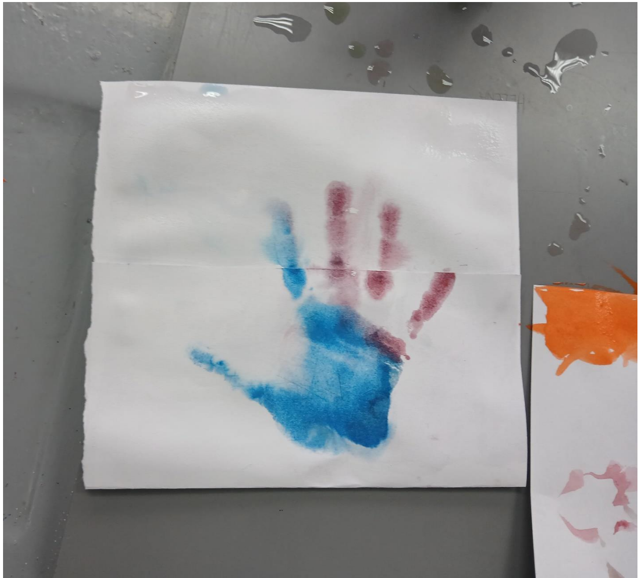
Akvarel u šaci