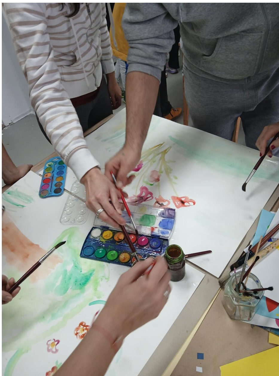
Akvarelska mešavina – „puno vode – malo boje „