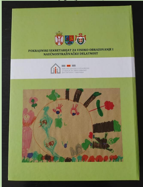
Slika 2: Korice knjige (poledina)

„Nacrtala sam veselu planetu, vidi joj se osmeh. Ovde su svi srećni jer planeta nije zagađena, nema puno automobila, ljudi idu peške, voze troketete. Biljke su lepe, jer niko nije vozio kroz travu i cveće već su išli stazom. I tako je naša planeta ostala zdrava.“