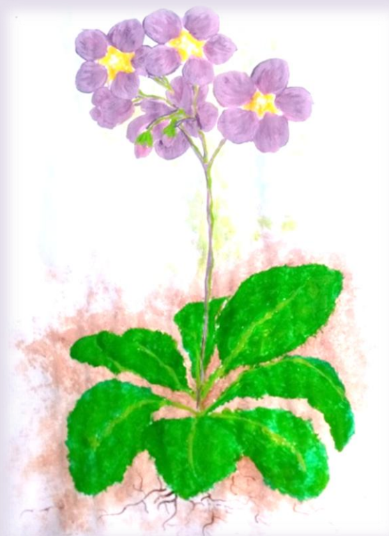
Slika 2: „Feniks – cvet koji može da oživi“, vaspitačica Milana Duraković-Nađalin, vrtić „Miki“, Predškolska ustanova „Dragoljub Udicki“ Kikinda