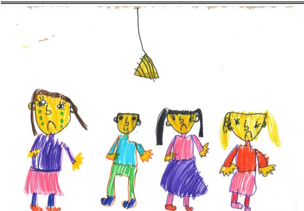
Slika 1: Crtež deteta predškolskog uzrasta na temu nasilja

Savremena nauka proširuje rezilijentnost kroz celoživotni razvoj uzimajući u obzir višestruke nivoe analize – od molekularne do kulturne, ali i istražuje višestruke sisteme – od porodice i škole do šire sredine i nacije (Masten, 2014). Različite studije se susreću u modelu rezilijentnosti zasnovanog na teoriji relacionih razvojnih sistema koja tvrdi da se kapacitet za kompetentnost u bilo kojoj tački razvoja odražava na mogućnosti koje proizlaze iz mnogih interaktivnih sistema unutar i oko same osobe (Overton, 2013). Ove interakcije između individualnih sistema i sredinskog konteksta rizika doprinose procesima ranjivosti, zaštite i diferencijalne osetljivosti koji neosporno utiču na kapacitet da se uspešno odgovori na nedaću.