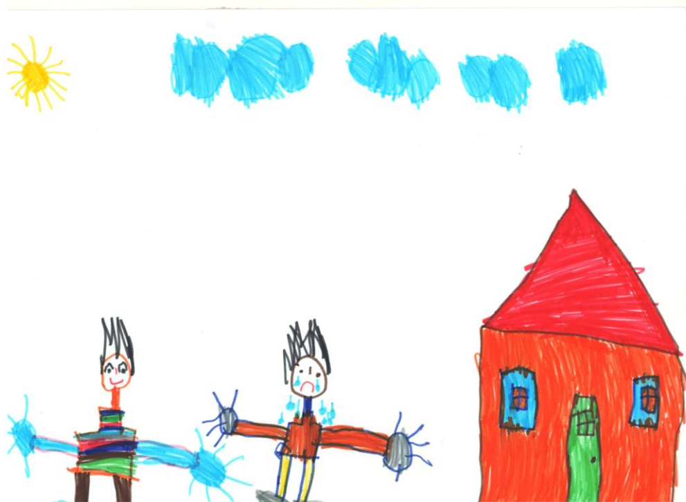
Slika 1: Crtež deteta predškolskog uzrasta na temu "Nasilje"

U radovima većine domaćih istraživača (Genc, 1994; Mihić, Zotović i Petrović, 2006; Kodžopeljić, Pekić i Genc, 2008, prema Pavićević i Stojilković 2016) prevladava dvodimenzionalni model vaspitnih stavova, dok je Milivojević (2007) na osnovu sopstvenog psihoterapijskog iskustva predstavio tzv. Mercedes model kojim utvrđuje roditeljske vaspitne stilove i ističe da postavljeni stilovi vaspitanja zavise od zastupljenosti tri dimenzije: prva dimenzija odnosi se na vaspitna sredstva koja prate i potkrepljuju detetovo dobro ponašanje; druga dimenzija odnosi se na kažnjavanje i kritikovanje; a treća dimenzija se odnosi na zahteve i roditeljska očekivanja. Milivojević je stilove prikazao vizuelno ( mercedes model – šematski prikaz podseća na znak mercedesa) u obliku kruga sa tri kraka. Svaki krak se odnosi na jednu od tri dimenzije kojim se određuje roditeljski stil vaspitanja. Dužina kraka odgovara zastupljenosti date dimenzije, a zavisno od zastupljenosti ove tri dimenzije, autor određuje roditeljski stil vaspitanja.