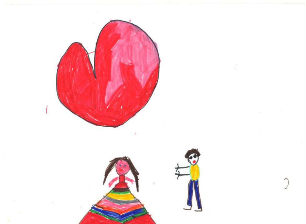
Slika 3: Dečji crtež na temu „Vršnjačko nasilje“

Istraživanja realizovana na ovoj populaciji potvrđuju da u vreme kada deca pohađaju predškolske ustanove ona mogu biti uključena u nasilna ponašanja, te da je nasilje među decom predškolskog uzrasta prisutno. Istraživanje Ladda i Burgessa (1999, prema Vlachou et al., 2013) pokazalo je da deca u vrtiću imaju tendenciju da se agresivno ponašaju ili da doživljavaju agresivna ponašanja od druge dece. Ipak, predškolska deca na drugačiji način shvataju i razumeju pojam nasilja među vršnjacima (kroz pojam žrtve) u odnosu na decu školskog uzrasta koja mogu da razlikuju i više vrsta nasilja i koja ističu postojanje straha od ponavljanja nekog neprilagođenog oblika ponašanja nad njima (Vlachou et al., 2013).