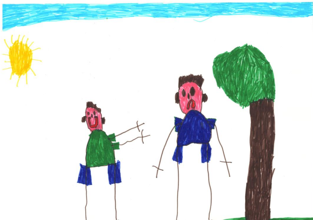
Slika 2: Crtež deteta predškolskog uzrasta na temu "Nasilje"

korelira sa reakcijama uznemirenosti. Topham i saradnici (2011) ustanovili su da između autoritativnog (demokratskog) roditeljskog vaspitnog stila, merenog pomoću kontinuiranih skala Upitnika roditeljskih vaspitnih stilova i dimenzija, i minimizirajućih i kažnjavajućih reakcija postoji negativna korelacija.