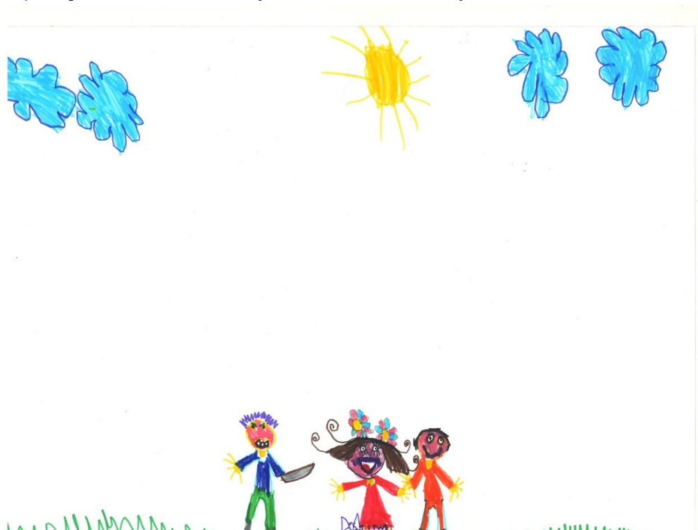
Slika 2: Dečji crtež na temu „Vršnjačko nasilje”

agresivnost češće sankcioniše od strane okoline. Prema razvojnoj teoriji agresivnosti Bjorkqvista i sar. (1992, prema Kaukiainen i sar., 1999), treći razvojni oblik izražavanja agresivnosti je indirektna agresivnost. Za pojavu indirektna agresivnosti potrebna je određena razvijenost socijalne inteligencije, koja se povećava s uzrastom (Kaukiainen i sar., 1999).