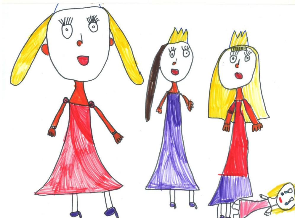
Slika 1: Dečji crtež na temu „Vršnjačko nasilje“

prema Sesar, 2011). Osećaju se usamljenije i manje srećno, te imaju manje dobrih prijatelja (Nansel et al., 2001, 2004, prema Sesar, 2011). U poslednje vreme, istraživači su se počeli baviti ispitivanjem karakteristika dece koja trpe nasilje, ali se i nasilno ponašaju prema drugima. Oko polovina ispitanika koji su identifikovani kao počinioci nasilja izveštava da su bili i izloženi nasilju. Decu koja trpe nasilje, ali se i nasilno ponašaju prema drugima (tzv. „provokativne žrtve“), karakteriše osobnost koja se delimično preklapa s karakteristikama počinitelja nasilja ali i karakteristikama dece koja su izložena nasilju, ali se čini da se oni ipak razlikuju u nekim područjima od ostalih učesnika vršnjačkog nasilja (Rigby, 2002, prema Sesar, 2011).