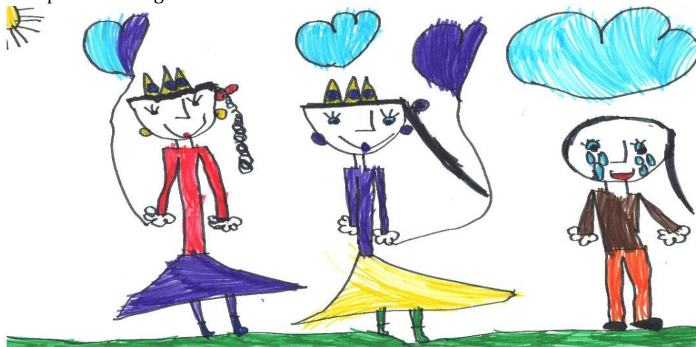
Slika 3: Crtež deteta predškolskog uzrasta (pripremno-predškolska grupa) na temu „Nasilje“, flomasteri

opredeljivali za one ajteme koji u sebi sadrže reč fizičko (ajtem 9) – p9=83,18 % ili direktno ukazuje na fizičke povrede (ajtem 7) – p7=53,45 %. I kod ponašanja koja ukazuju na zanemarivanje imamo kombinaciju odgovora (n11=112; n12=111; n13=119 i n14= 148), što je ohrabrujuće jer ukazuje na svesnost vaspitača o kompleksnosti pojave nasilja nad detetom. Indikatore ponašanja seksualnog zlostavljanja ispitanici svrstavaju u ovaj vid zlostavljanja samo kod tvrdnje koja ima u sebi reč seksualno te neposredno ukazuje na ovaj vid zlostavljanja – p17=46,43 %. I kod ove grupe tvrdnji, ispitanici su se odlučivali za kombinaciju odgovora (n15= 115; n16=113 i n17=112). Kod tvrdnji koje ukazuju na emotivno zlostavljanje imamo kombinaciju odgovora p18=117; p19=107 i p20=123. Ovi rezultati pokazuju da vaspitači uviđaju da se ponašanje koje ukazuje na zlostavljanje i zanemarivanje ne može striktno podeliti na vrste ponašanja, nego da se javljaju kombinovano i time negativno deluju na razvoj dece predškolskog uzrasta.