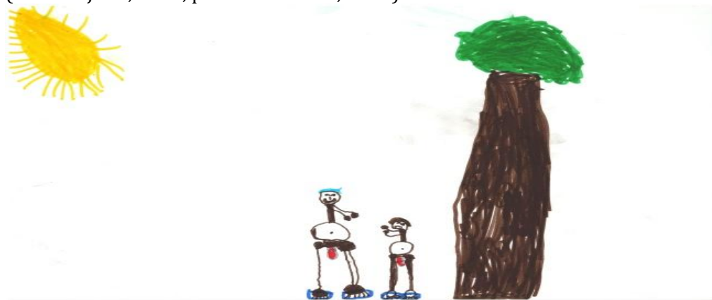
Slika 2: Crtež predškolskog deteta (pripremno-predškolska grupa) na temu „Nasilje“, flomasteri

Pod zapoštavljanjem podrazumeva se nedovoljna briga za razvojne potrebe deteta i njegovu ličnost. Zanemarivanje predstavlja odsustvo ili nedovoljno zadovoljavanje razvojnih i osnovnih potreba i socijalne sigurnosti deteta, dok je zlostavljanje ugrožavanje psihičkog i fizičkog integriteta ličnosti deteta (Milosavljević, 1998, prema Mošković, 2015).