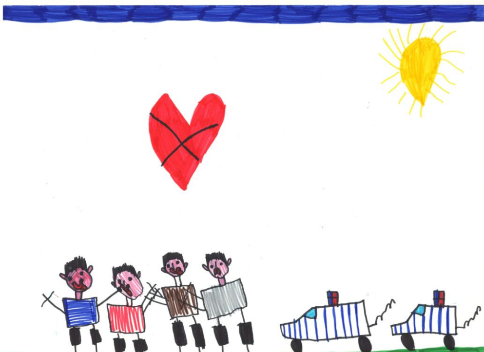
Slika 3: Crtež deteta predškolskog uzrasta na temu "Nasilje"

Distribucija dobijenih odgovora kao i dobijeni rezultati pokazuju da roditelji dece predškolskog uzrasta pretežno koriste autoritativni (demokratski) vaspitni stil , a to je onaj vaspitni stil koji se zasniva na bezuslovnoj ljubavi, to je topao i usmeravajući vaspitni stil. U demokratskom vaspitnom stilu roditelji poštuju dečje, ali i svoje potrebe, a i razvijen je autoritet vrednosti koji uvažava dečje mišljenje uz uzajamni odnos poštovanja. Kod deteta se razvija osećaj odgovornosti, samopouzdanja i sigurnosti (Matejević, 2000, prema Stefanović–Stanojević, 2006). Demokratski vaspitni stil je onaj u kojem roditelji pored toga što postavljaju zahteve i jasna pravila ponašanja, objašnjavajući pri tome deci razloge primenjivanja tih pravila, zadržavaju autoritet, a atmosfera u porodici je emocionalno topla i demokratska. U takvoj porodičnoj atmosferi dete zadržava osećanje pripadnosti i uvažavanja od strane roditelja koji koriste navođenje pri disciplinovanju dece. Roditelji postavljaju visoke standarde u ponašanju svoje dece i njihova deca su samopouzdana, sa dobrom kontrolom i željom da se afirmišu i izražavaju visoku kontrolu i emocionalnu privrženost deci. Demokratski vaspitni stil odraz je prihvatanja i poštovanja deteta. Takva deca razvijaju socijalnu odgovornost, nezavisnost i saradnju, a njihovi roditelji se nalaze visoko na dimenziji topline i nadzora, staraju se i osetljivi su prema svojoj