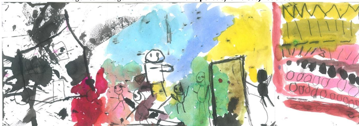
Slika 3: „Da sam Ja super-heroj”, dečak, 6 godina, Predškolska ustanova „Dragoljub Udicki”, Kikinda, vrtić Plavi čuperak”, vaspitačica Milana Demić

Obrada podataka izvršena je dvojako: numerički /tabelarno izračunavanjem indeksa (broj pozitivnih izbora, broj negativnih izbora, indeks prihvatanja, indeks odbacivanja i sociometrijski status deteta) i grafički – izradom sociograma.