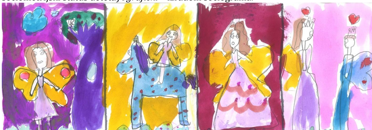
Slika 4: „Da sam Ja super-heroj”, devojčica, 6 godina, Predškolska ustanova „Dragoljub Udicki”, Kikinda, vrtić Plavi čuperak”, vaspitačica Milana Demić

Obrada podataka izvršena je dvojako: numerički /tabelarno izračunavanjem indeksa (broj pozitivnih izbora, broj negativnih izbora, indeks prihvatanja, indeks odbacivanja i sociometrijski status deteta) i grafički – izradom sociograma.