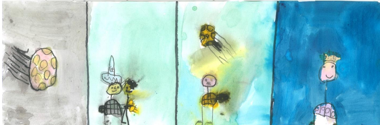
Slika 2: „Da sam Ja super-heroj“, dečak, 7 godina, Predškolska ustanova „Dragoljub Udicki“, Kikinda, vrtić Plavi čuperak“, vaspitačica Milana Demić

Sociometrijsko istraživanje je imalo cilj da utvrdi sociometrijski status gojazne i dece sa prekomernom težinom. Ukupan uzorak činilo je 83 dece predškolskog uzrasta iz predškolskih ustanova „Dragoljub Udicki“ iz Kikinde (N 1 =37) i „Srećno dete“ iz Novog Kneževca (N 2 =46) hronološkog uzrasta od 5,5 do 7 godina.