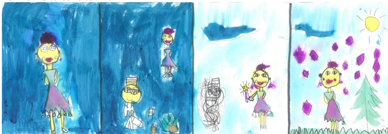
Slika 5: „Da sam Ja super-heroj”, devojčica, 6 godina, Predškolska ustanova „Dragoljub Udicki”, Kikinda, vrtić Plavi čuperak”, vaspitačica Milana Demić

Do sada obrađeni podaci i dobijeni rezultati ukazuju na to da gojazna i deca sa prekomernom težinom imaju prosečan socijalni status u vršnjačkoj grupi. Dalja obrada podataka će pokazati da li postoji diskriminacija u odnosu na decu koja su normalne telesne težine.