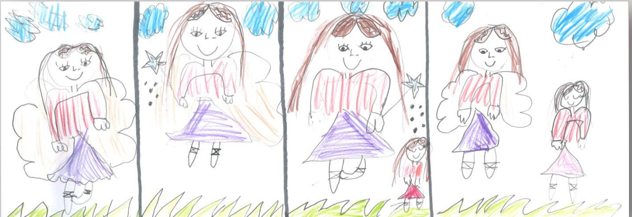
Slika 9: „Da sam Ja super-heroj”, devojčica, 6 godina, Predškolska ustanova „Dragoljub Udicki”, Kikinda, vrtić Plavi čuperak”