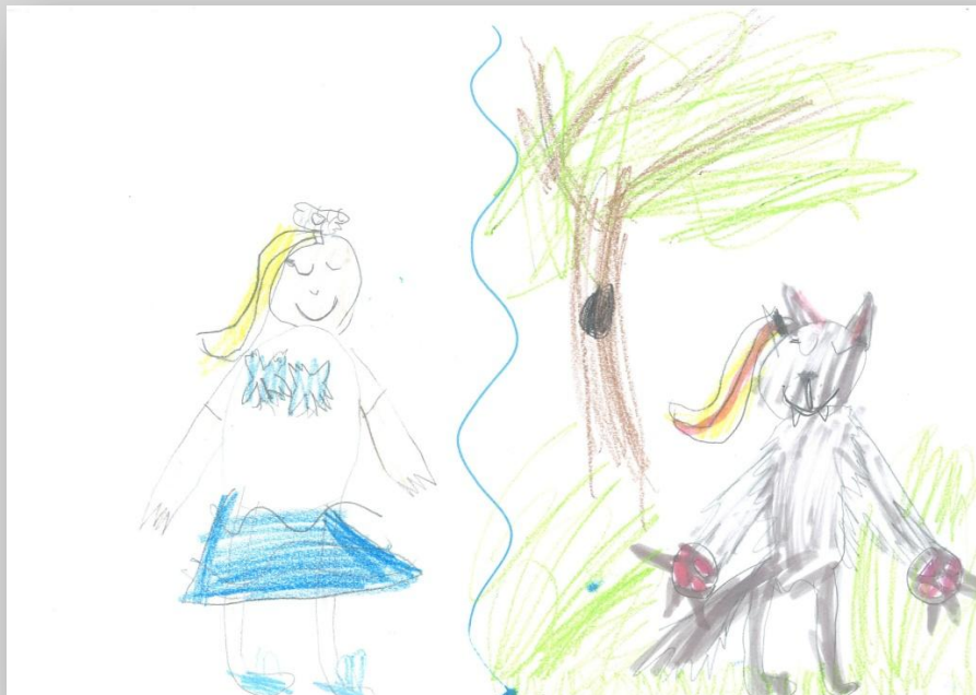
Slika 15: „Da sam Ja super-heroj”, devojčica, 7 godina, Predškolska ustanova „Dragoljub Udicki”, Kikinda, vrtić Plavi čuperak”