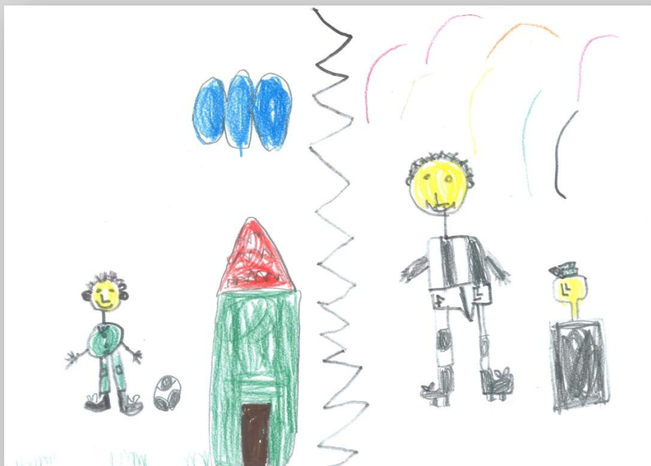
Slika 16: „Ja i idealno Ja”, dečak, 7 godina, Predškolska ustanova „Dragoljub Udicki”, Kikinda, vrtić Plavi čuperak”