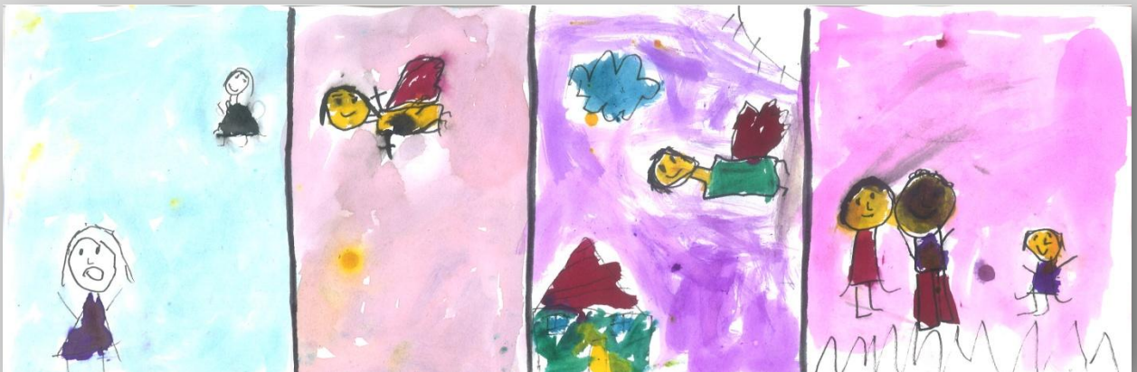
Slika 13: „Da sam Ja super-heroj”, devojčica, 7 godina, Predškolska ustanova „Dragoljub Udicki”, Kikinda, vrtić Plavi čuperak”