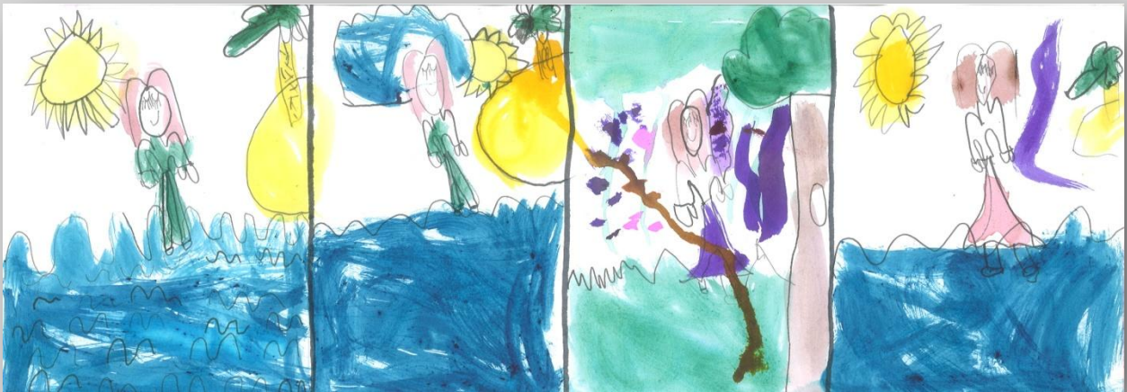
Slika 11: „Da sam Ja super-heroj”, devojčica, 6 godina, Predškolska ustanova „Dragoljub Udicki”, Kikinda, vrtić Plavi čuperak”