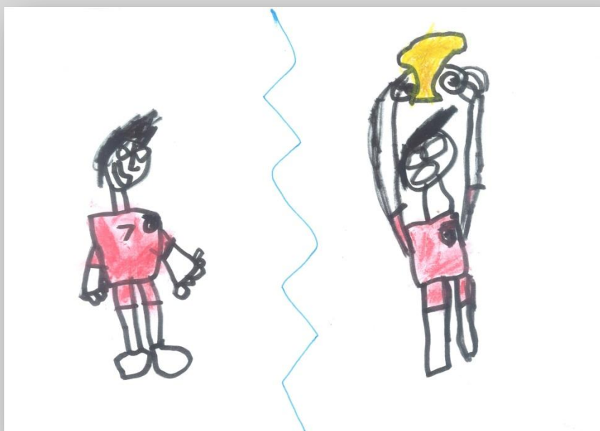
Slika 17: „Ja i idealno Ja”, dečak, 7 godina, Predškolska ustanova „Dragoljub Udicki”, Kikinda, vrtić Plavi čuperak”