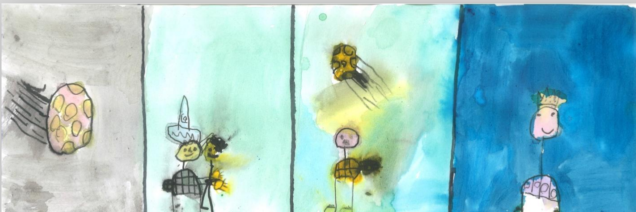
Slika 3: „ Da sam Ja super-heroj”, dečak, 7 godina, Predškolska ustanova „Dragoljub Udicki”, Kikinda, vrtić Plavi čuperak”