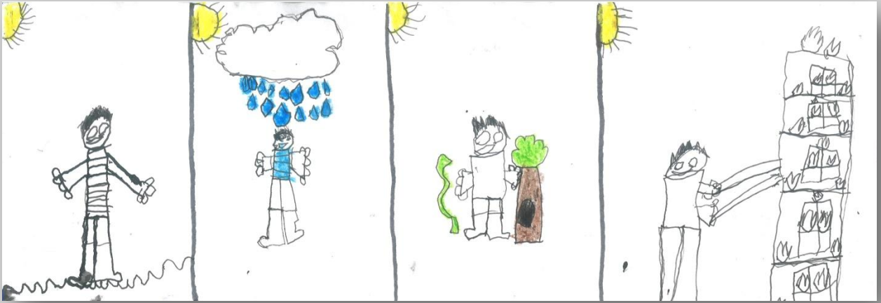
Slika 12: „Da sam Ja super-heroj”, dečak, 7 godina, Predškolska ustanova „Dragoljub Udicki”, Kikinda, vrtić Plavi čuperak”