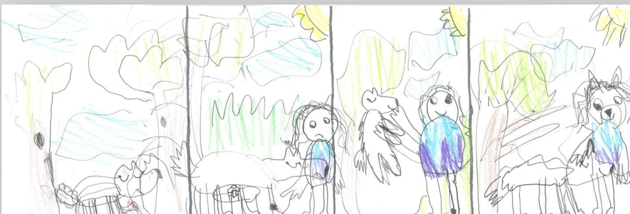
Slika 7: „Da sam Ja super-heroj”, devojčica, 6 godina, Predškolska ustanova „Dragoljub Udicki”, Kikinda, vrtić Plavi čuperak”