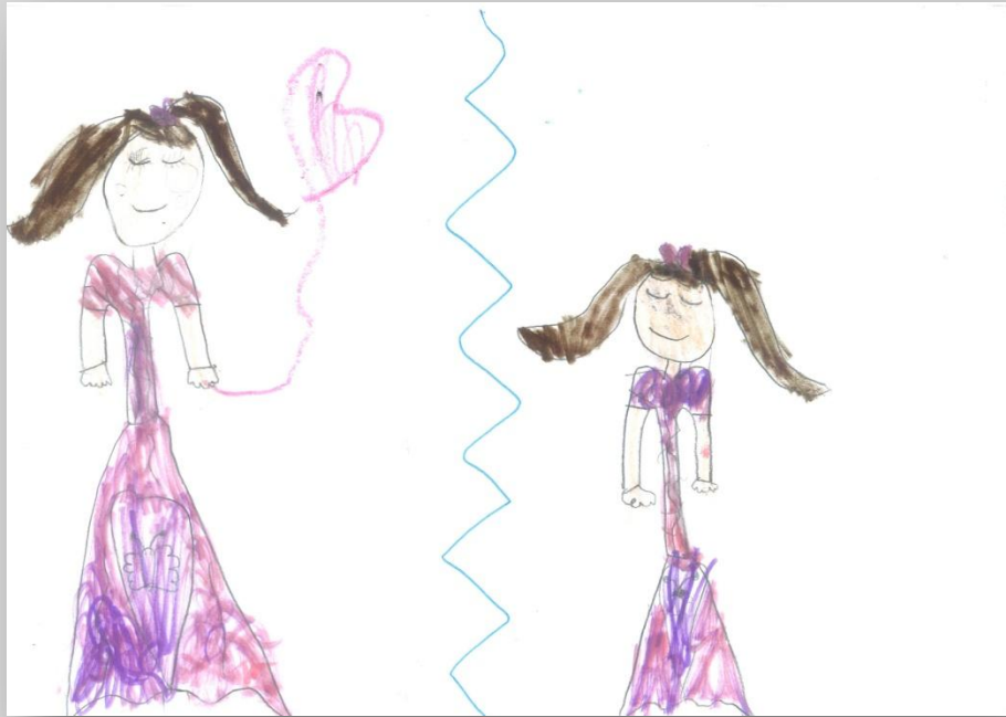
Slika 14: „Ja i idealno Ja”, devojčica, 7 godina, Predškolska ustanova „Dragoljub Udicki”, Kikinda, vrtić Plavi čuperak”