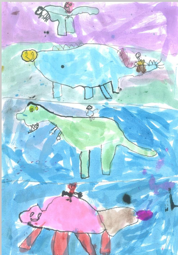
Slika 1: „Da sam Ja super-heroj”, dečak, 5 godina, Predškolska ustanova „Dragoljub Udicki”, Kikinda, vrtić Plavi čuperak”,