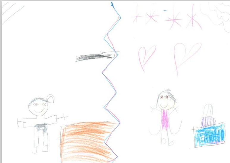
Slika 19: „Ja i idealno Ja”, devojčica, 7 godina, Predškolska ustanova „Dragoljub Udicki”, Kikinda, vrtić Plavi čuperak”