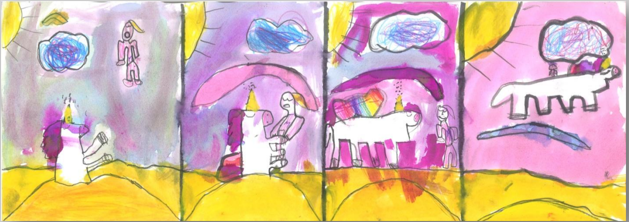
Slika 8: „Da sam Ja super-heroj”, devojčica, 6 godina, Predškolska ustanova „Dragoljub Udicki”, Kikinda, vrtić Plavi čuperak”