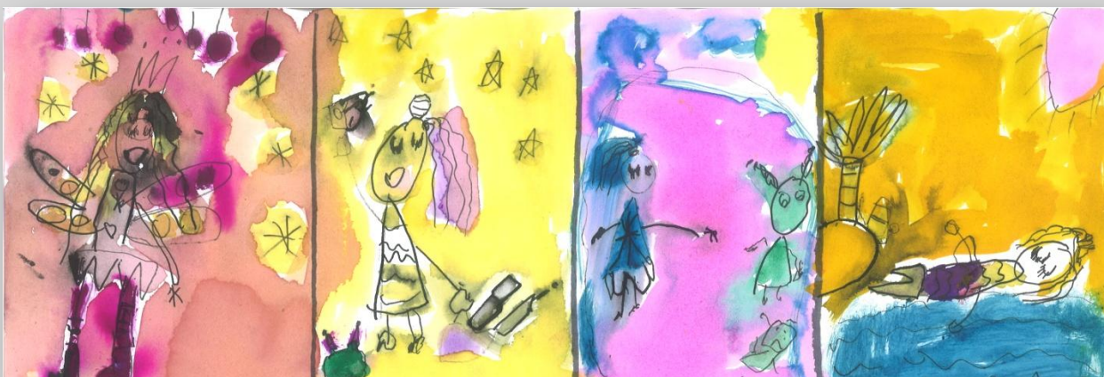
Slika 2: „ Da sam Ja super-heroj”, devojčica, 6 godina, Predškolska ustanova „Dragoljub Udicki”, Kikinda, vrtić Plavi čuperak”