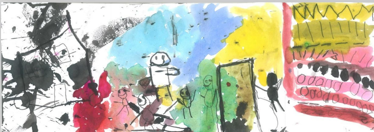
Slika 4: „Da sam Ja super-heroj”, dečak, 6 godina, Predškolska ustanova „Dragoljub Udicki”, Kikinda, vrtić Plavi čuperak”