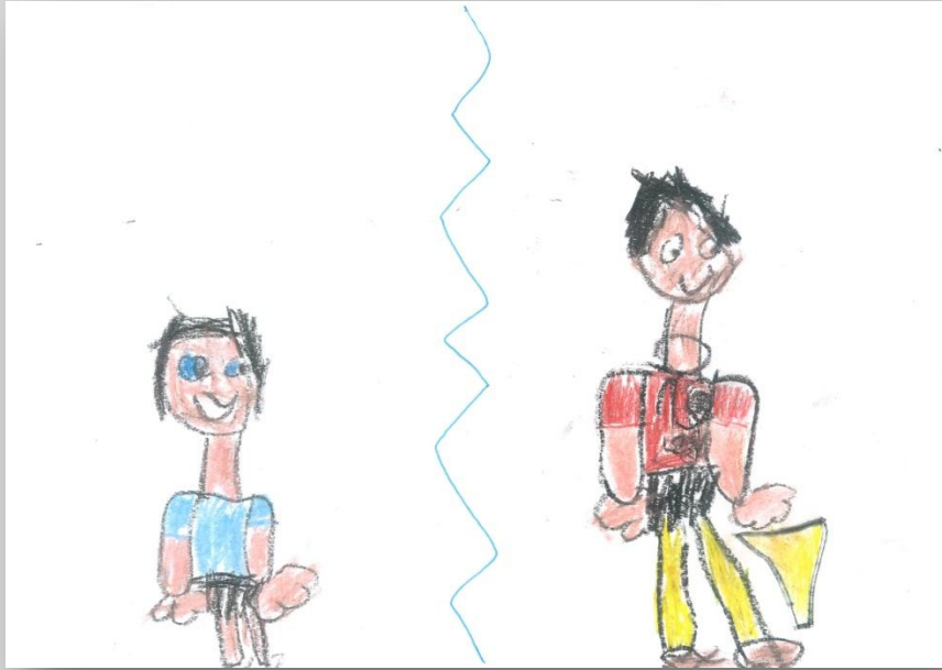
Slika 18: „Ja i idealno Ja”, dečak, 5 godina, Predškolska ustanova „Dragoljub Udicki”, Kikinda, vrtić Plavi čuperak”