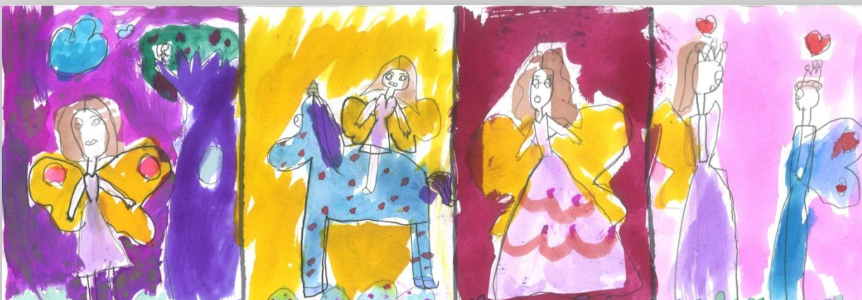
Slika 5: „ Da sam Ja super-heroj”, devojčica, 6 godina, Predškolska ustanova „Dragoljub Udicki”, Kikinda, vrtić Plavi čuperak”