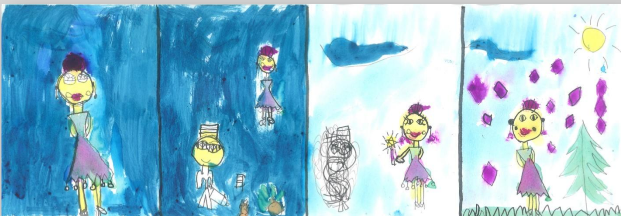
Slika 6: „Da sam Ja super-heroj”, devojčica, 6 godina, Predškolska ustanova „Dragoljub Udicki”, Kikinda, vrtić Plavi čuperak”