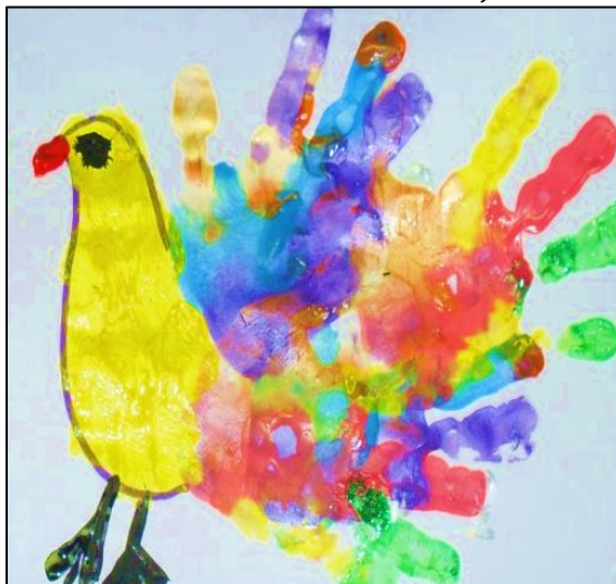
Slika 1: Produkt dečje likovne aktivnosti u okviru projekta, Predškolska ustanova „Dragoljub Udicki”, Kikinda

Druga faza projekta se odnosila na akciono istraživanje, odnosno na realizaciju radionica za podsticanje samopoštovanja i samopouzdanja kod dece predškolskog uzrasta na ukupnom uzorku od 373 dece kojeg čine poduzorci od 153 dece Predškolske ustanove „Dragoljub Udicki” iz Kikinde i 220 dece Predškolske ustanove „Dečija radost” iz Iriga.