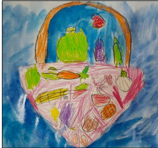
Slika 2: Produkt dečje likovne aktivnosti u okviru projekta, Predškolska ustanova „Dragoljub Udicki“, Kikinda

Istraživanje u Predškolskoj ustanovi „Dečija radost“ u Irigu, realizovano je na uzorku od 220 dece predškolskog uzrasta od 3 do 6 godina. Devetnaest vaspitača ove predškolske ustanove sa decom svojih vaspitnih grupa je u toku maja meseca 2021. godine sprovelo 5 radionica: „Kad sam bio mali“; „Deca opisuju sebe i svoje telo“; „Moja lična karta“; „Zid slavnih“ i „Osoba (dete) dana“.