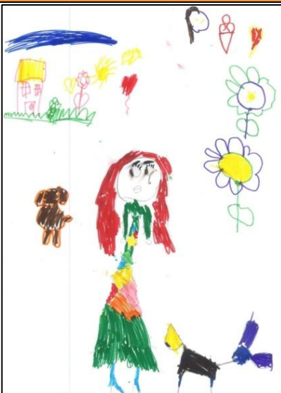
Slika 5: „Osoba dana“, devojčica, 5 godina, Predškolska ustanova „Dečija radost“, Irig

Dobijeni podaci akcionog istraživanja u PU „Dragoljub Udicki“ u Kikindi i PU „Dečija radost“ u Irigu predstavljaju značajne preporuke za rad vaspitača na unapređivanju samopoštovanja i podsticanju samopouzdanja kod dece predškolskog uzrasta uz jačanje dečje pozitivne slike o sebi kao i senzibiliteta za druge i drugačije, a protiv diskriminacije gojaznih imajući u vidu da je utvrđeno postojanje jake veze između gojaznosti i niskog samopoštovanja kao i da se jednom stvoreno nisko samopoštovanje kod dece dugo zadržava, ukoliko se ne interveniše.