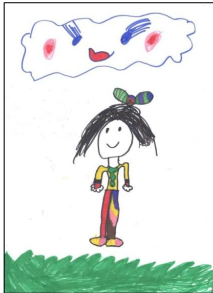
Slika 3: „Moja lična karta“, devojčica, 5 godina, Predškolska ustanova „Dečija radost“, Irig

Istraživanje u Predškolskoj ustanovi „Dečija radost“ u Irigu, realizovano je na uzorku od 220 dece predškolskog uzrasta od 3 do 6 godina. Devetnaest vaspitača ove predškolske ustanove sa decom svojih vaspitnih grupa je u toku maja meseca 2021. godine sprovelo 5 radionica: „Kad sam bio mali“; „Deca opisuju sebe i svoje telo“; „Moja lična karta“; „Zid slavnih“ i „Osoba (dete) dana“.